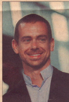
A leading internal candidate, according to people close to the board, is co-founder and interim leader and Jack Dorsey